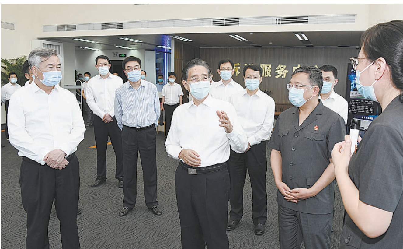
6月18日至21日，中共中央政治局委员、中央政法委书记郭声琨在广东调研。图为郭声琨来到广州互联网法院调研。